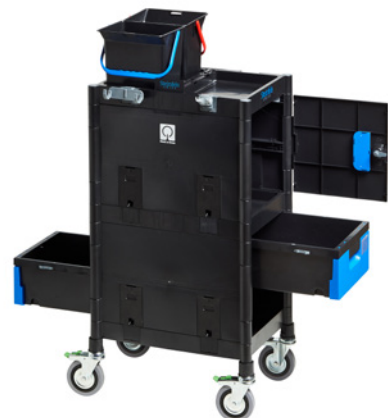
Art. BiG 506065