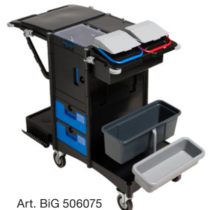
Art. BiG 506075